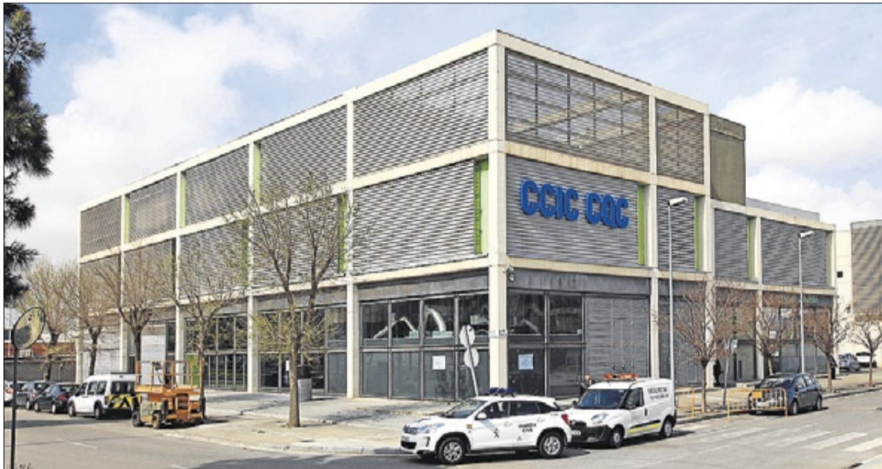
►► El edificio que ocupa el laboratorio de certificación de productos de CCIC, en L'Hospitalet.